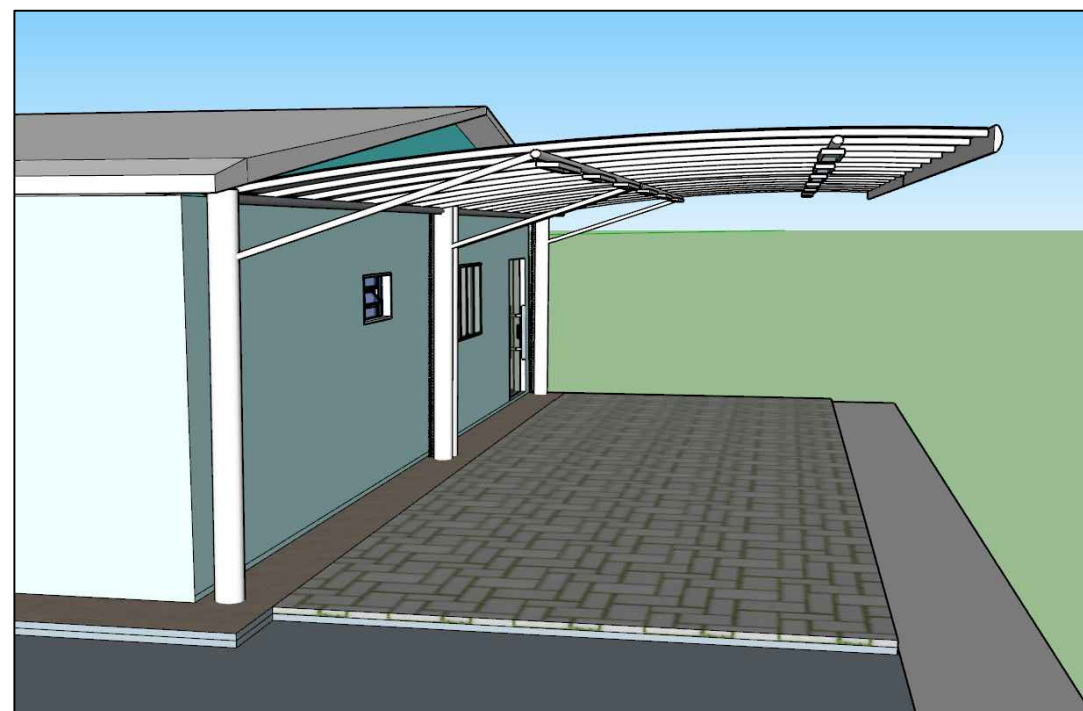
FACHADA LATERAL DIREITA